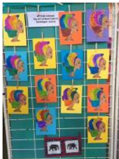
L'école Ferdinand Buisson et sa