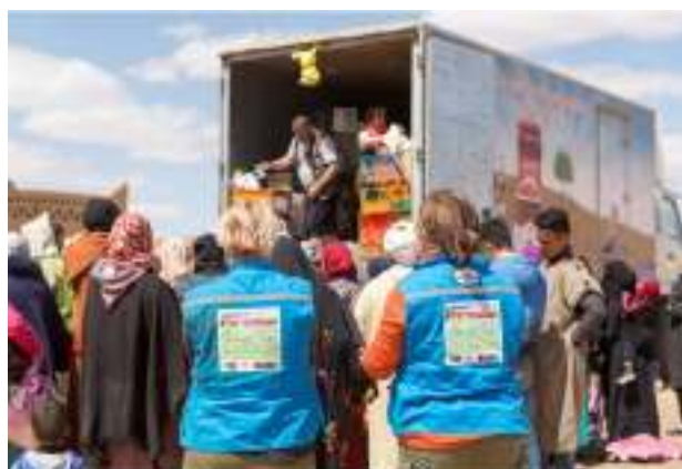
La livraison au Maroc