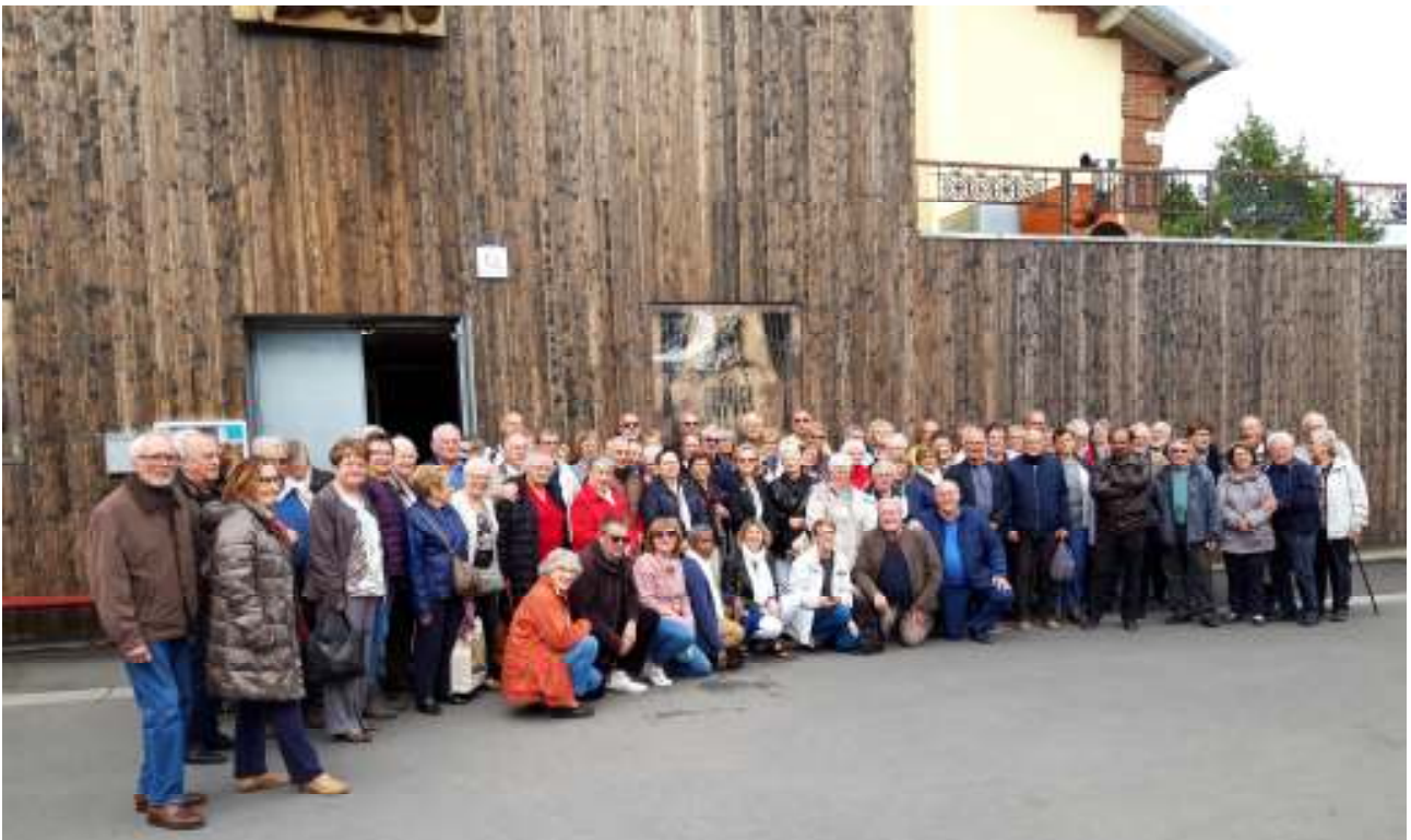
La photo de famille le 13 juin