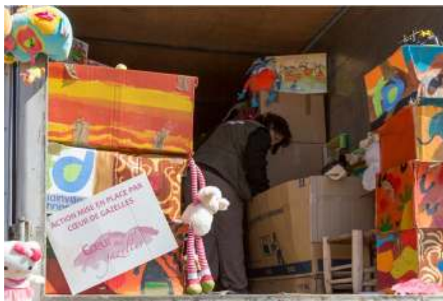
Le logo FD bien présent dans le camion en direction du Maroc