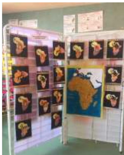
belle exposition sur l'Afrique