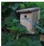
Diamètre du trou 30-32mm

Vous pouvez d'ici là procéder individuellement à différents types de traitements possibles, pour cela il existe plusieurs méthodes de lutte contre la chenille processionnaire