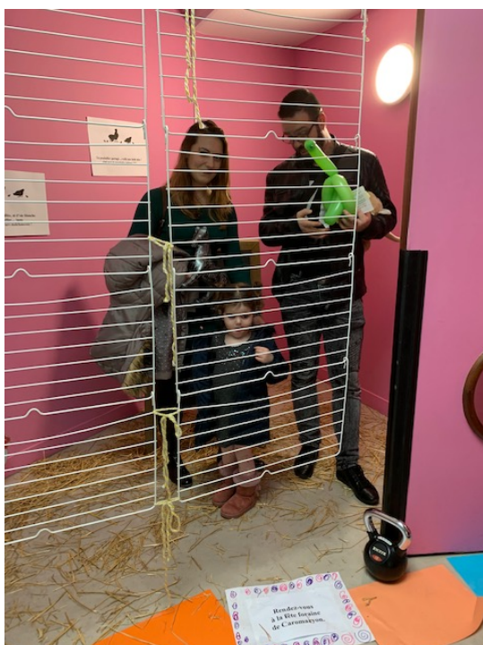
Les parents avaient droit à la prison ce jour là !