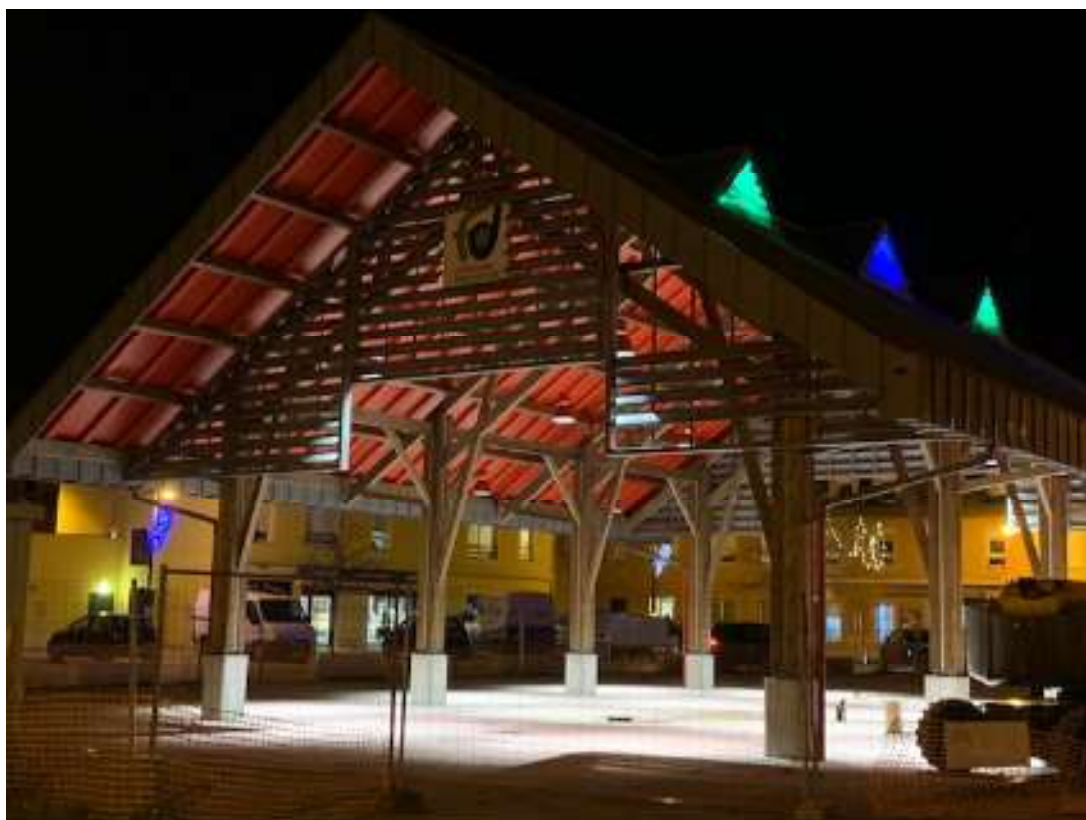
La halle : notre cadeau de Noël 2019 !

Concert inaugural de nos 4 nouveaux vitraux offert par l'association « Valeurs et culture »