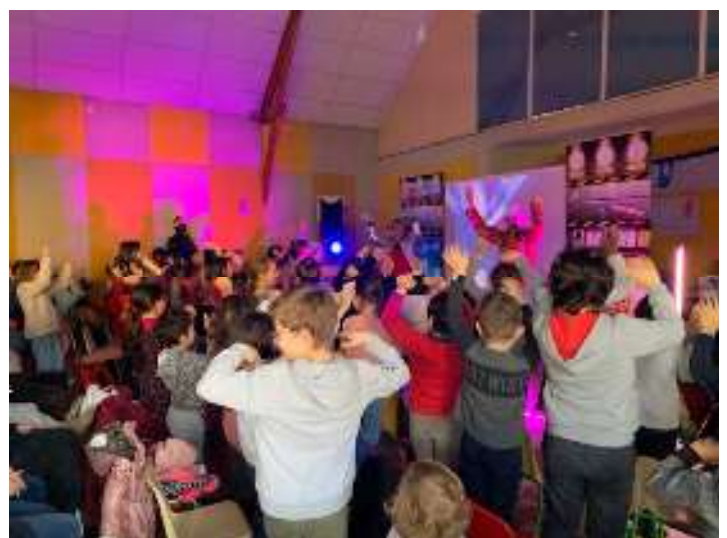
Noël pour les enfants. Cette année les artistes ont fait l'unanimité !