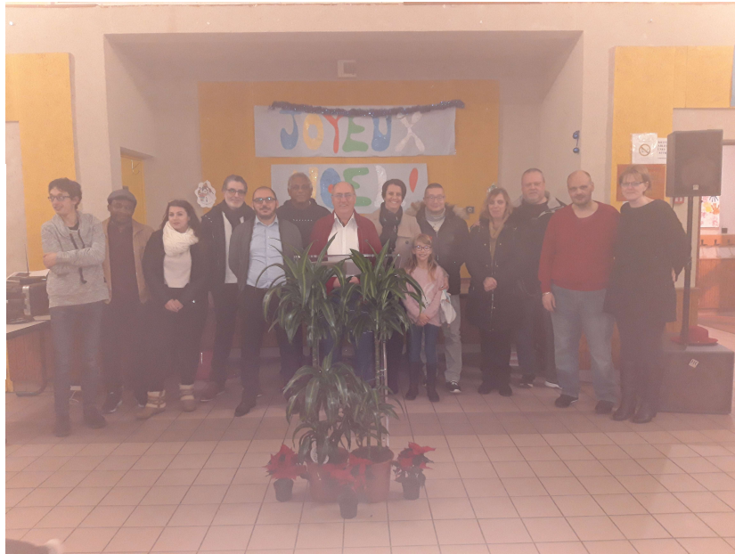
Les nouveaux arrivants accueillis le 13 décembre (navré pour la qualité de la photo)