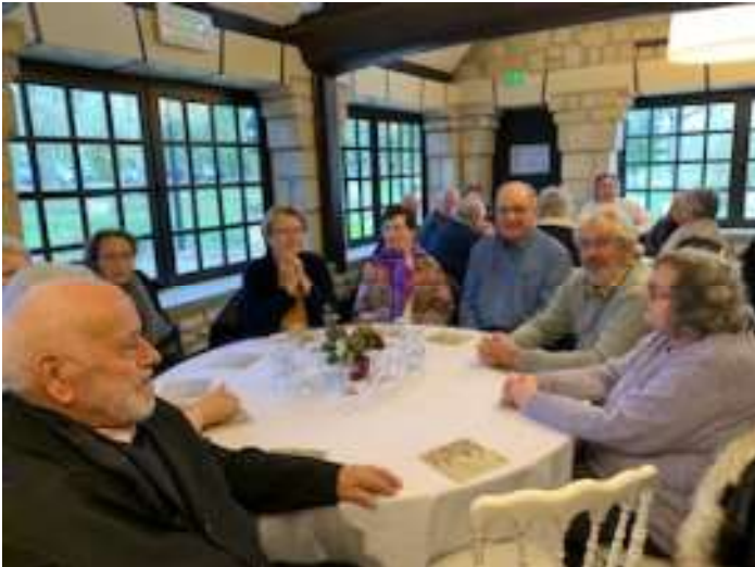
Réception haut de gamme pour nos anciens à la Tour Duval samedi 14 décembre