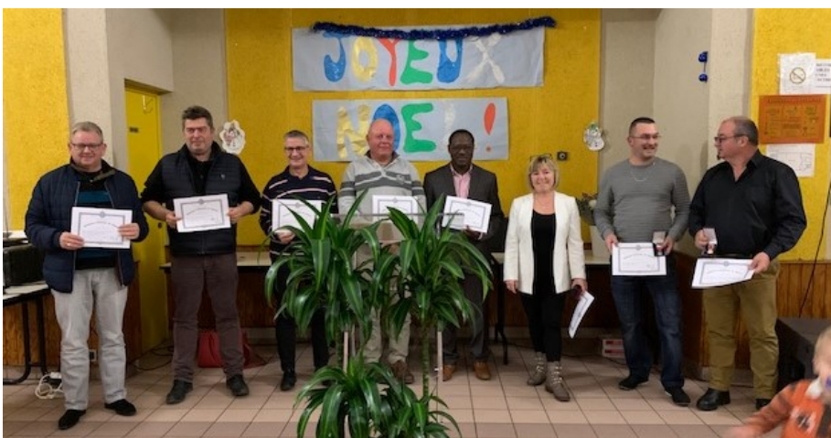
Les médaillés du travail 2019