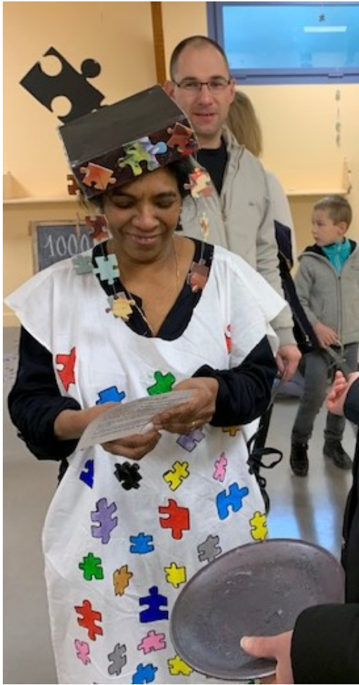
La fête aux « Farfadets » Elle en aura endossé des costumes et des chapeaux Mala !