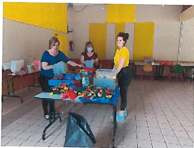
Nettoyage des jouets