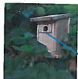
Diamètre du trou 30-32 mm

Vous pouvez procéder individuellement à différents types de traitements possibles, pour cela il existe plusieurs méthodes de lutte contre la chenille processionnaire.