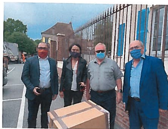
Livraison des masques