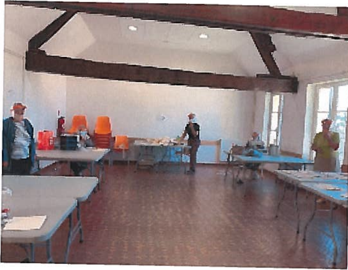
Quelques couturières en plein travail....