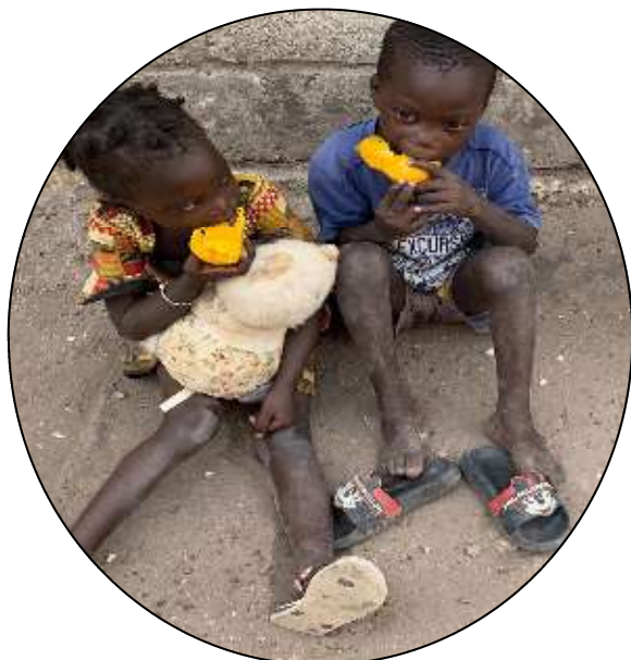
Pleine saison pour les mangues au Sénégal actuellement !