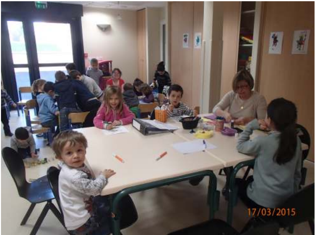
Nos jeunes administrés ont bien investi la nouvelle garderie !