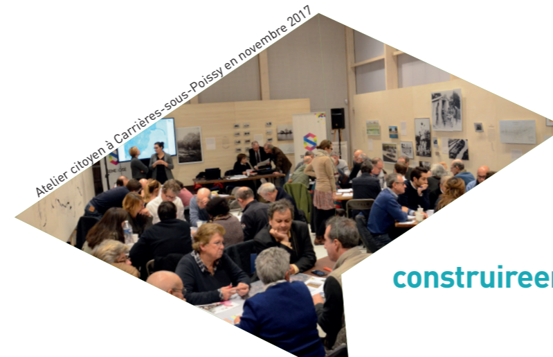
Atelier citoyen à Carrières-sous-Poissy en novembre 2017