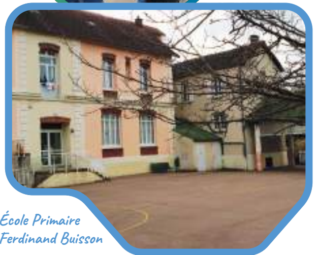
École Primaire Ferdinand Buisson

2 Rendez-vous : Sous la Halle de Dennemont à 15H Devant la Mairie à 15H30