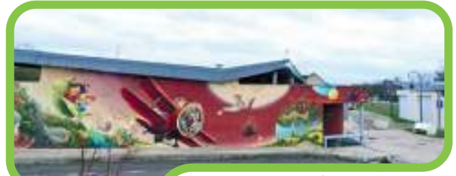
École Primaire Le Petit Prince

Après-midi Journée verte Petit Prince & Ferdinand Buisson