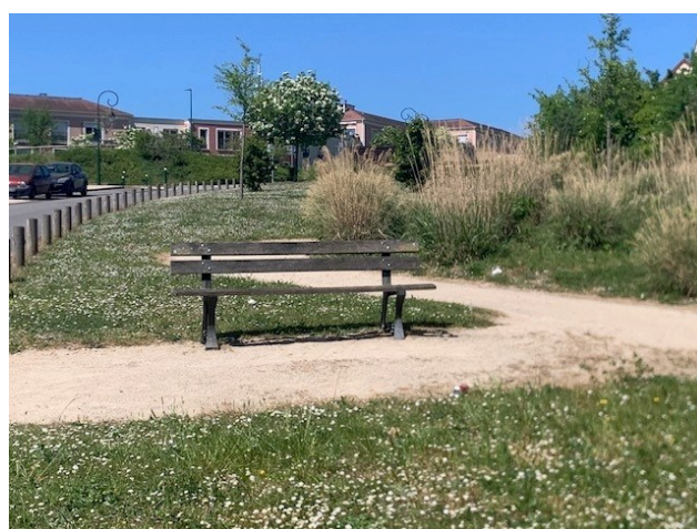
Un tapis de pâquerettes c'est sympa ? Pourquoi les faire disparaître à coup de tondeuse ?!