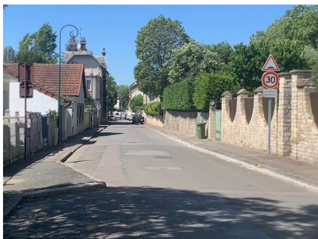
Dès le 30 avril rue Jean Jaurès est bien nette