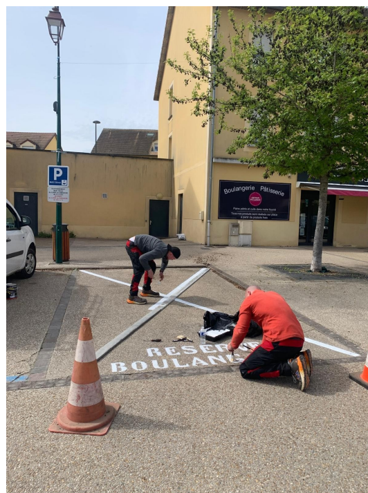
Laissez sa place à notre boulanger qui a souvent des livraisons !