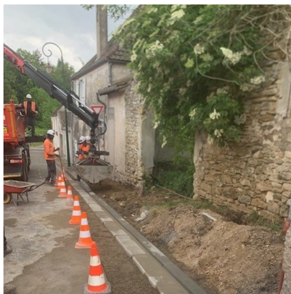
Nous abaissons actuellement les bordures de trottoirs au droit de nos futures aires de stationnement