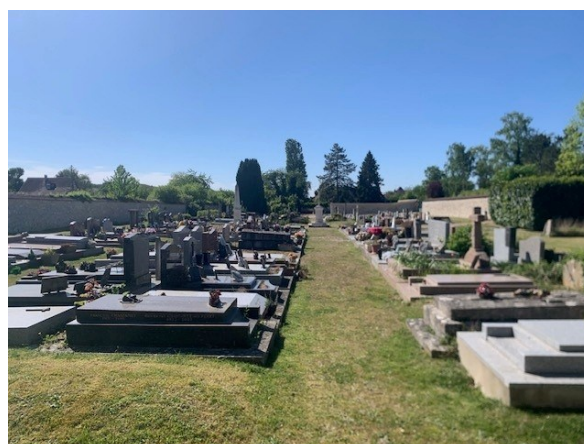
Nos deux cimetières, 2 fois tondu depuis le 22 mars