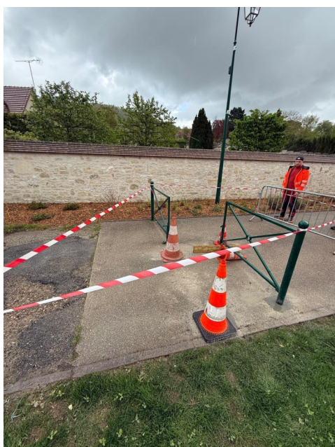
Enfin les poussettes peuvent passer le long du cimetière