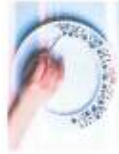
Peinture sur porcelaine