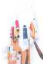
Peinture à l'huile