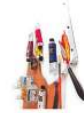
Peinture à l'huile