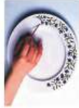
Peinture sur porcelaine